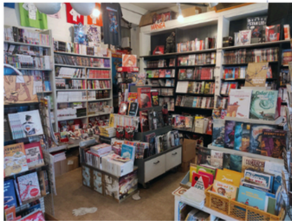
Praktikum in einem Comic- und Buchladen