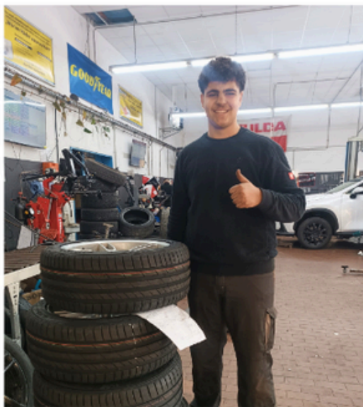
Praktikum in einer Autowerkstatt